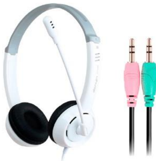
دارای اتصال دوتایی مناسب برای رایانه های شخصی PC