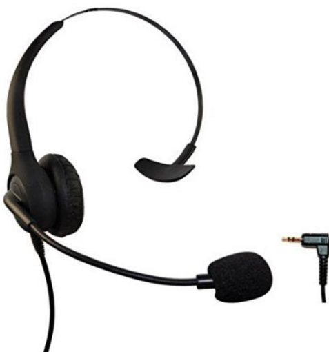
دارای اتصال تکی مناسب برای لپ تاپ، تبلت و گوشی موبایل

دو مدل اصلی و مرسوم در بازار به شرح تصویر زیر می باشد که می بایست متناسب با نوع رایانه اعم از PC، لپ تاپ، تبلت و یا تلفن همراه، اقدام به خرید نمود.